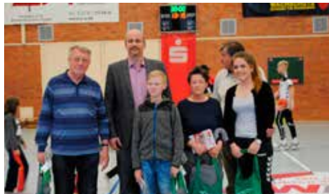
Hier das Gewinnerbild

In der Halbzeitpause des letzten Spiels der 1. Männer in der Oberliga Ostsee/Spree gegen den Stralsunder HV wurde traditionell die Tombola „Unser Handballmagazin“ mit Preisen des Sponsors – VBB – durchgeführt.