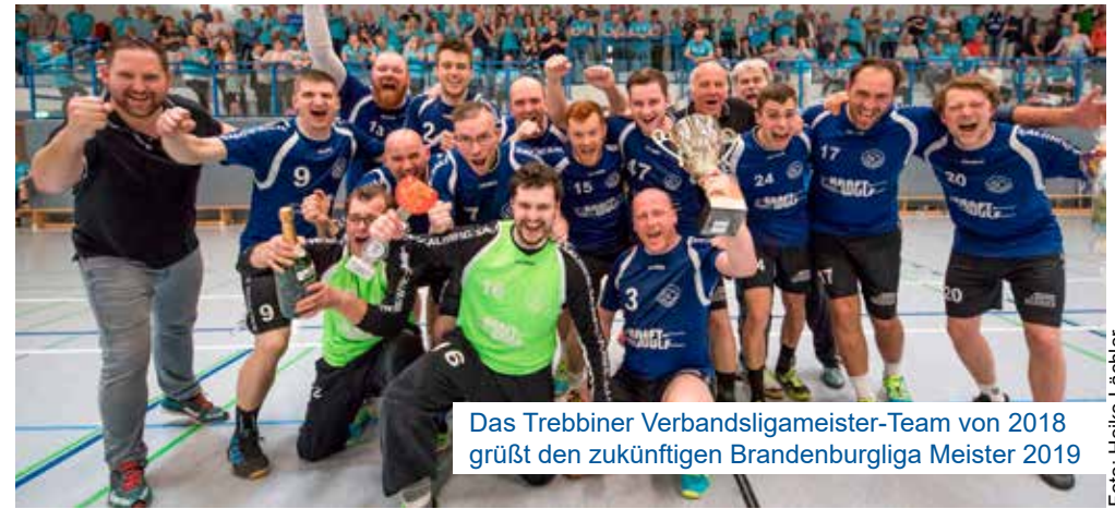
Das Trebbiner Verbandsligameister-Team von 2018 grüßt den zukünftigen Brandenburgliga Meister 2019